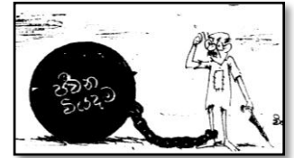
W. R விஜயசோம